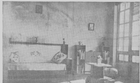
SALA DE LECTURA